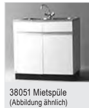
38051 Mietspüle (Abbildung ähnlich)