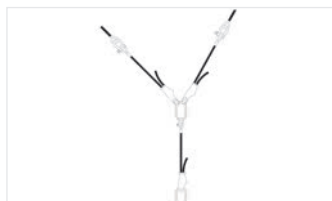
32900 und 32979 Befestigungspunkt mit Drop

Bitte beachten: Zur Bearbeitung der Bestellung ist eine genaue Positions- und Höhenangabe der benötigten Befestigungspunkte erforderlich. Vermaßte Standskizze (Maßstab 1:100 oder 1:50) bitte unbedingt beifügen.