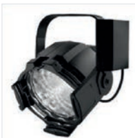
Tageslichtscheinwerfer 150 W – 575 W