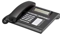
37002 IP Telefon