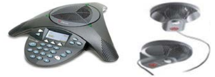
37006 Konferenztelefon mit zus. Mikrofon